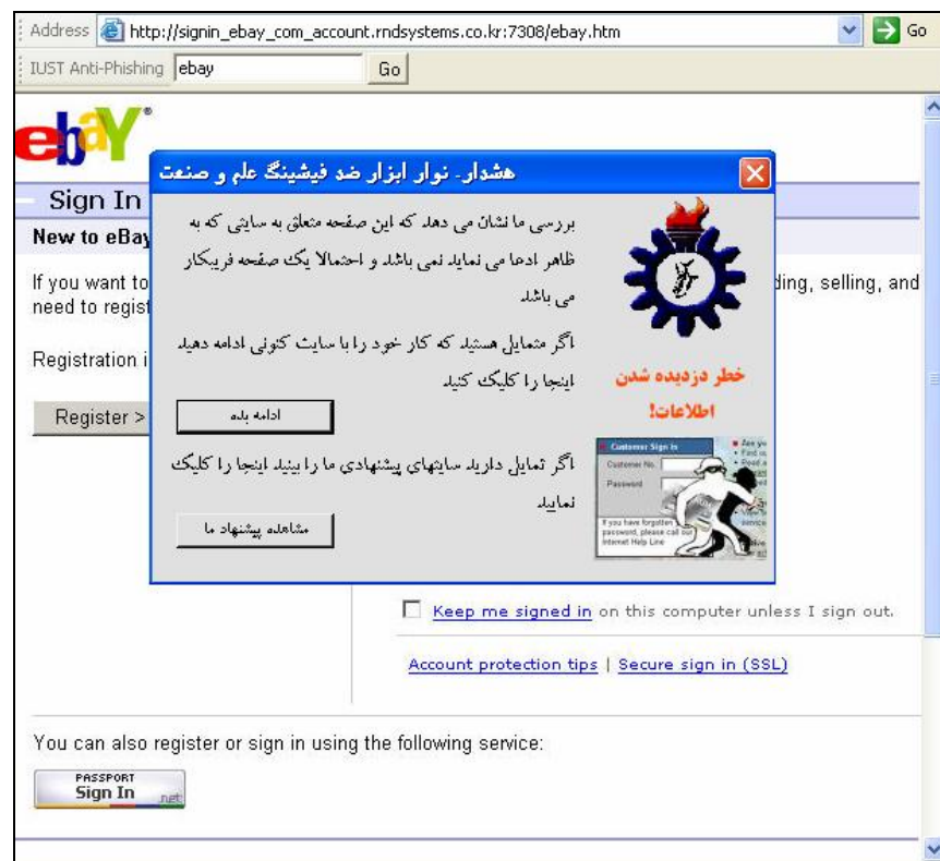
شکل ۳: نوار ابزار ضدفیشینگ علم و صنعت در مواجهه با سایت فیشینگ